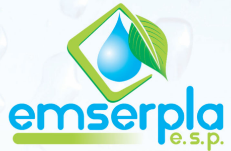
MATRIZ DE RIESGOS