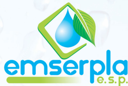
MATRIZ DE RIESGOS