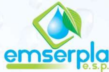
MATRIZ DE RIESGOS