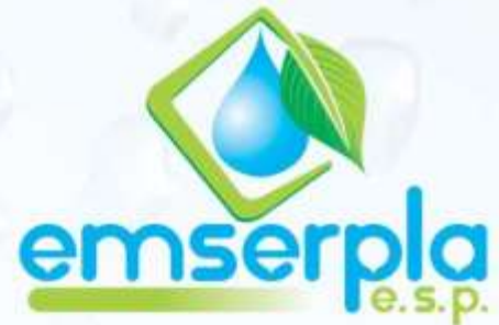
MATRIZ DE RIESGOS